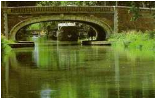
Canal du Midi