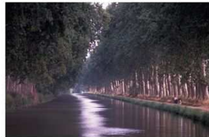
Canal du Midi